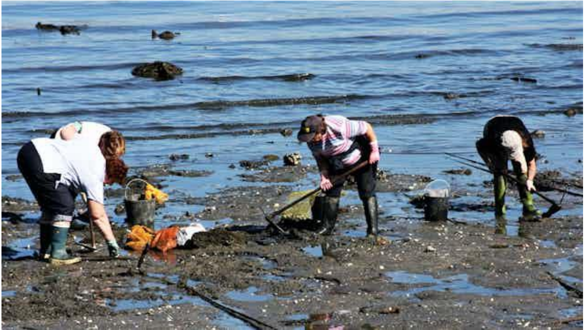
Mariscadoras na ría de Ferrol (Galicia).

A recolección de marisco a pé remóntase aos albores do tempo. O influxo da Lúa determina as mareas e é na baixamar cando os areais quedan accesibles para a actividade marisqueira.